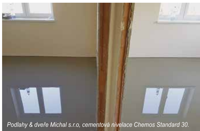
Podlahy & dveře Michal s.r.o, cementová nivelace Chemos Standard 30.