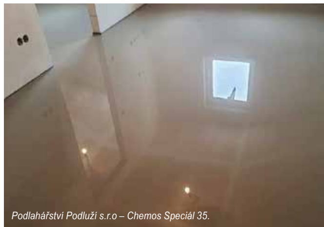
Podlahářství Podluží s.r.o – Chemos Speciál 35.