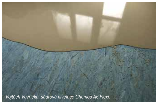
Vojtěch Vavříčka, sádrová nivelace Chemos A6 Flexi.