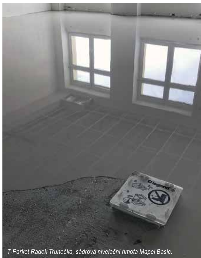
T-Parket Radek Trunečka, sádrová nivelací hmota Mapei Basic.

Každopádně mohu zodpovědně říct, že neznám chemii, která by úplně nefungovala. Každý výrobce má ve svém portfoliu různé kvality, které odpovídají ceně nebo tomu, jak se na podlaze chovají. Je tedy na podlaháři, jakou cestou se vydá, zda cestou ceny, anebo cestou profíka. My v Cechu podlahářů ČR máme spoustu výrobců chemie, kteří jsou připraveni podlahářům naservírovat své produkty tak, aby fungovaly. Když se pokladači nepovede nivelace, může za to většinou špatná výrobní šarže jeho sedmi dodaných pytlů – ano, to si někteří opravdu myslí. Realita je ale jiná: pravděpodobnost, že se dodá vadná nivelace, je tak 1 %, zbytek „vady“ je mezi hlavou pokladače a podlahou.